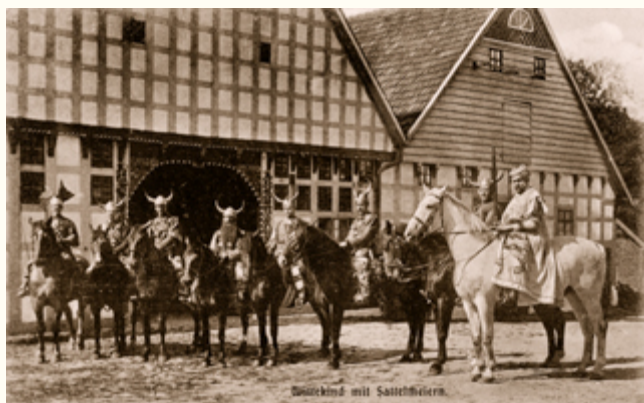
(3) Kostümgruppe „Herzog Wittekind mit den Sattelmeiern“ vor dem Uphof anlässlich der Grafenschaftsfeier 1909.

In Dokumenten des 17. und 18. Jahrhunderts werden die Upmeier zu Belzen als „Sattelmeier“ bezeichnet. Die Sattelmeier sind eine Besonderheit des Ravensberger Landes, genauer gesagt, des früheren Amtes Sparrenberg, das von der Bielefelder Sparrenburg aus verwaltet wurde. Die Sattelmeier waren Besitzer großer und wohlhabender Höfe, die dem Landesherrn auf Anforderung ein gesatteltes Pferd und einen bewaffneten Reiter zu stellen hatten. Der Landesherr, das war zunächst der Herzog von Jülich-Kleve-Berg in Düsseldorf, ab 1609 dann der Kurfürst von Brandenburg bzw. später der König von Preußen. Bereits im ersten Verzeichnis der Sattelmeier im Amt Sparrenberg von 1590 wird der Hof Upmeier genannt. Die Dienstpflicht bestand nicht lange, 1739 wurde sie bereits gegen eine Geldzahlung abgeschafft. Doch die Sattelmeier genossen weiterhin besonderes Ansehen und in Enger spannt sich eine Sage um die Sattelmeier, wonach sie Nachkommen der Gefolgsleute Widukinds, des sächsischen Gegenspielers Karls des Großen sein sollen.