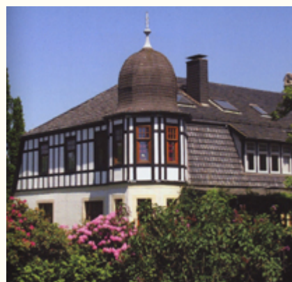
(12) Der 1907 von Gustav Upmeier errichtete Wohnflügel im Jugendstil