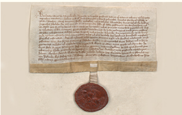
(1) Die Ersterwähnung der „curtis Uphof to Belsnen in parochia Julenbecke" in einer Urkunde Graf Bernhards von Ravensberg vom 7. März 1346

Ab dem späten 12. Jahrhundert änderten sich die wirtschaftlichen Verhältnisse in Westfalen grundlegend: Es entstand ein dichtes Netz von Städten mit Markt- und Handelsrechten. Die Grundherren konnten nunmehr Überschüsse aus ihrer Grundherrschaft verkaufen und das, was sie für die eigene Haushaltung benötigten, auf Märkten und bei Händlern kaufen. Sie verloren das Interesse an eigenen Gutshöfen und übergaben sie den Verwaltern in Erbpacht. Die Meier- und Schultenhöfe wurden damit zu abgabepflichtigen bäuerlichen Anwesen.