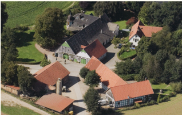
(13) Der heutige Hof Upmeier zu Belzen in einem Luftbild von 2010