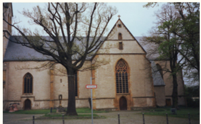
(2) Der Uphof gehörte zur Grundherrschaft des Stiftes Schildesche. Hier die ehemalige Stiftskirche, ein gotischer Bau von ca. 1330/40.