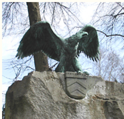
(11) Das Grafschaftsdenkmal in Jöllenbeck von 1909