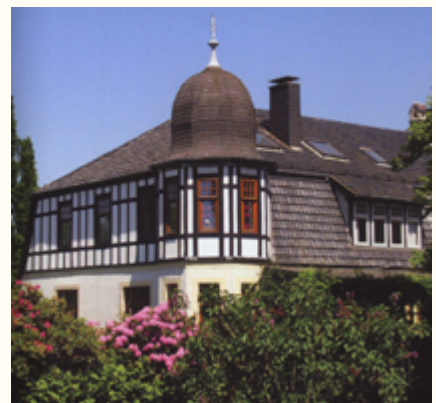
(12) Der 1907 von Gustav Upmeier errichtete Wohnflügel im Jugendstil