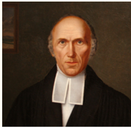
(8) "Erweckungsprediger" Johann Heinrich Volkening