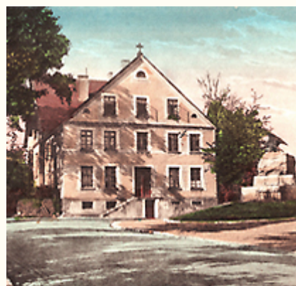
(9) Das Armen- und Waisenhaus in Jöllenbeck (Ansicht nach 1909)