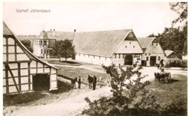
(14) Postkartenansicht des Hofes Upmeier zu Belzen von 1909