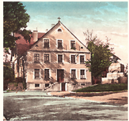
(9) Das Armen- und Waisenhaus in Jöllenbeck (Ansicht nach 1909)